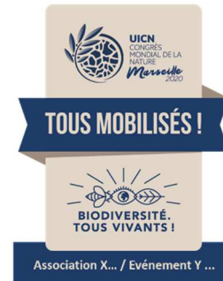
Visuel avec intitulé de l'organisme ou de l'événement

Les indications suivantes doivent être respectées dans le cadre de l'utilisation de ce visuel :