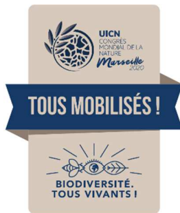
Visuel de base

Un visuel spécifique « Tous mobilisés ! » a été créé par l'UICN à la demande du ministère de la Transition écologique et solidaire (MTES) afin de valoriser les événements organisés par les collectivités locales et organisations à but non lucratifs au cours de l'année 2020 en faveur de la préservation de la biodiversité. Il présente deux variantes :